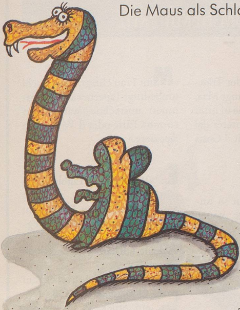
Die Maus als Schlange