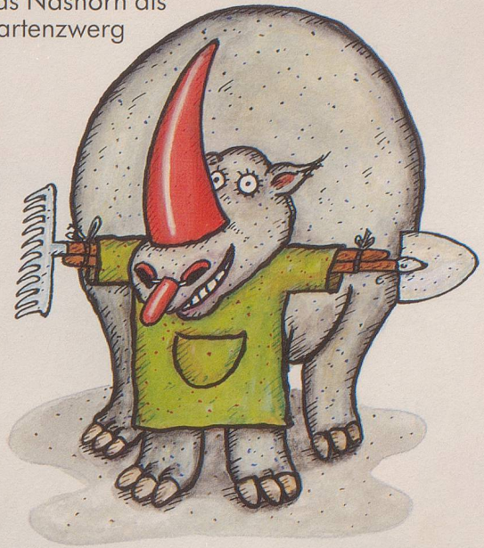
Das Nashorn als Gartenzwerg