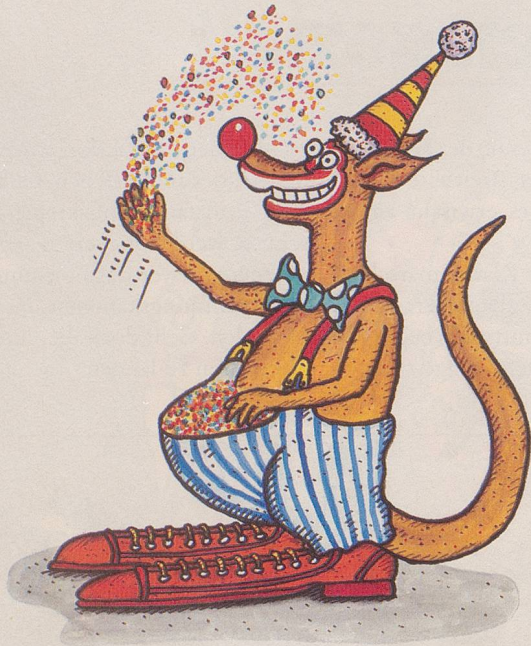
Das Känguruh als Konfetti-Clown