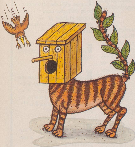
Die Katze als Vogelhaus