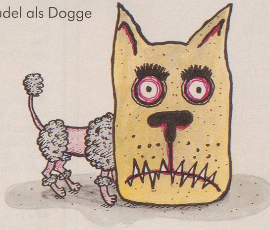
Der Pudel als Dogge