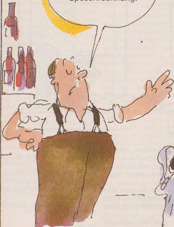
Wirte haben es natürlich einfach.

Aus ethischen und religiösen Gründen verweigere ich jeglichen Steuerdienst.