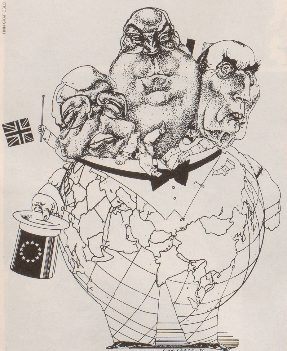
EG-Gipfel in Maastricht

Ich will die Gruselstunde des allzu ehrlichen Maklers nicht über Gebühr ausdeh-