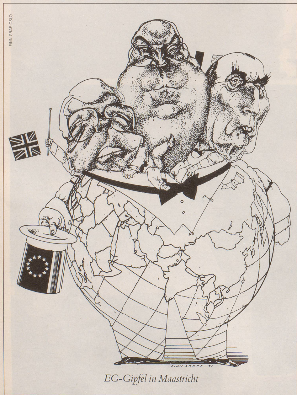
EG-Gipfel in Maastricht

Ich will die Gruselstunde des allzu ehrlichen Maklers nicht über Gebühr ausdeh-