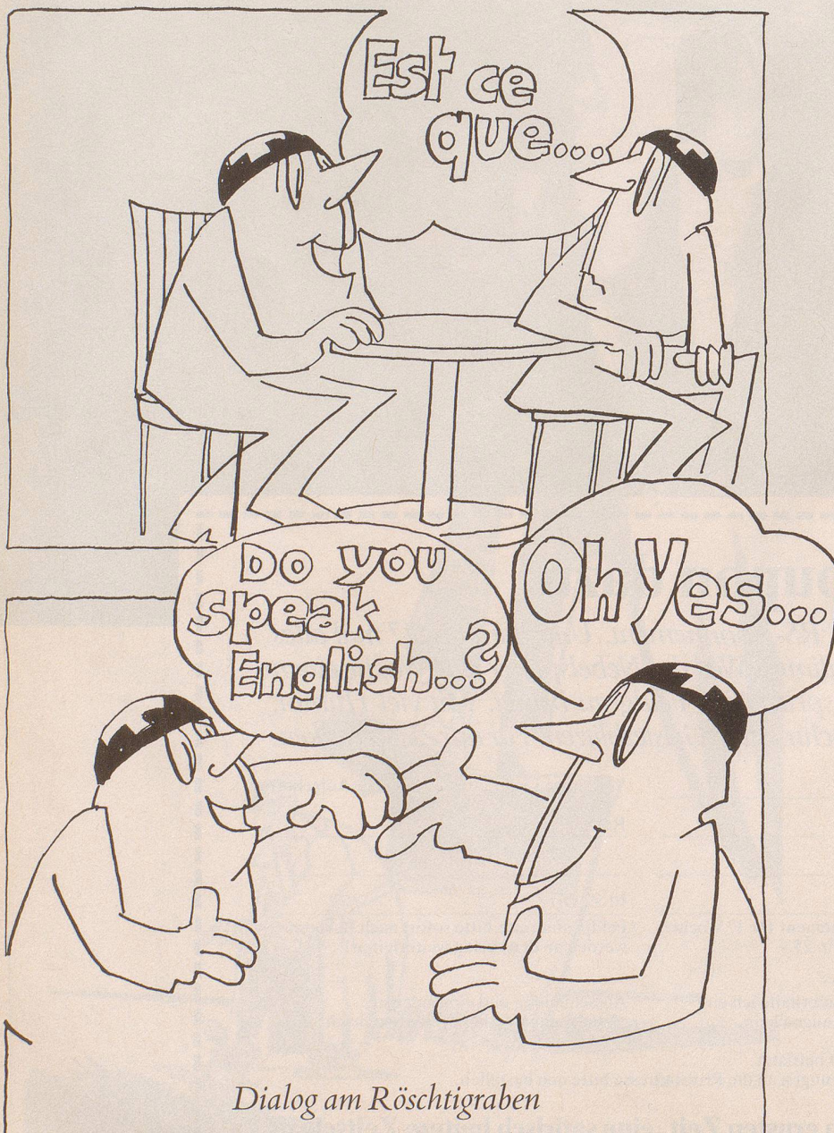
Dialog am Röschtigraben

Zuerst war es ein feines, undefinierbares Kribbeln in der rechten grossen Zehe, nach wenigen Tagen machte es sich schon stärker in der Bauchgegend bemerkbar, dann hat es sich in wenigen Tagen über Zwölffingerdarm und Niere zusehends weiter nach oben verschoben und ist zu Beginn des neuen Jahres im Herzen angelangt. Im Anfangsstadium machte sich keiner viele Gedanken darüber; wenn das Ganze aber immer mehr den Körper in Beschlag zu nehmen droht, wird ein Besuch beim Arzt unumgänglich.