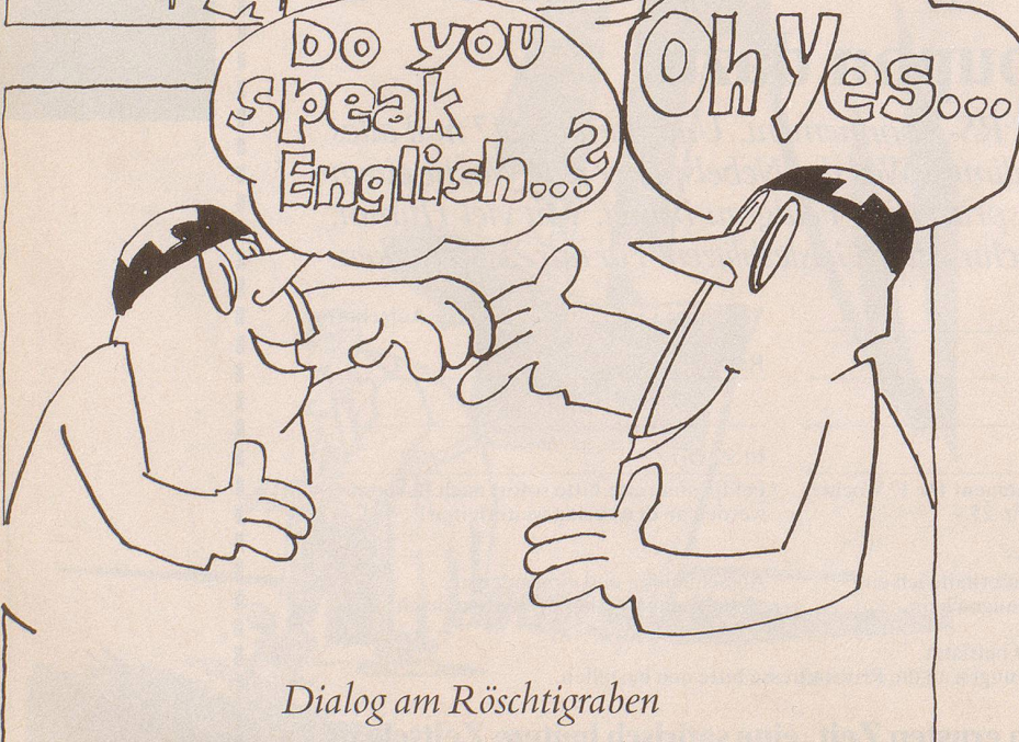
Dialog am Röschtigraben

Zuerst war es ein feines, undefinierbares Kribbeln in der rechten grossen Zehe, nach wenigen Tagen machte es sich schon stärker in der Bauchgegend bemerkbar, dann hat es sich in wenigen Tagen über Zwölffingerdarm und Niere zusehends weiter nach oben verschoben und ist zu Beginn des neuen Jahres im Herzen angelangt. Im Anfangsstadium machte sich keiner viele Gedanken darüber; wenn das Ganze aber immer mehr den Körper in Beschlag zu nehmen droht, wird ein Besuch beim Arzt unumgänglich.