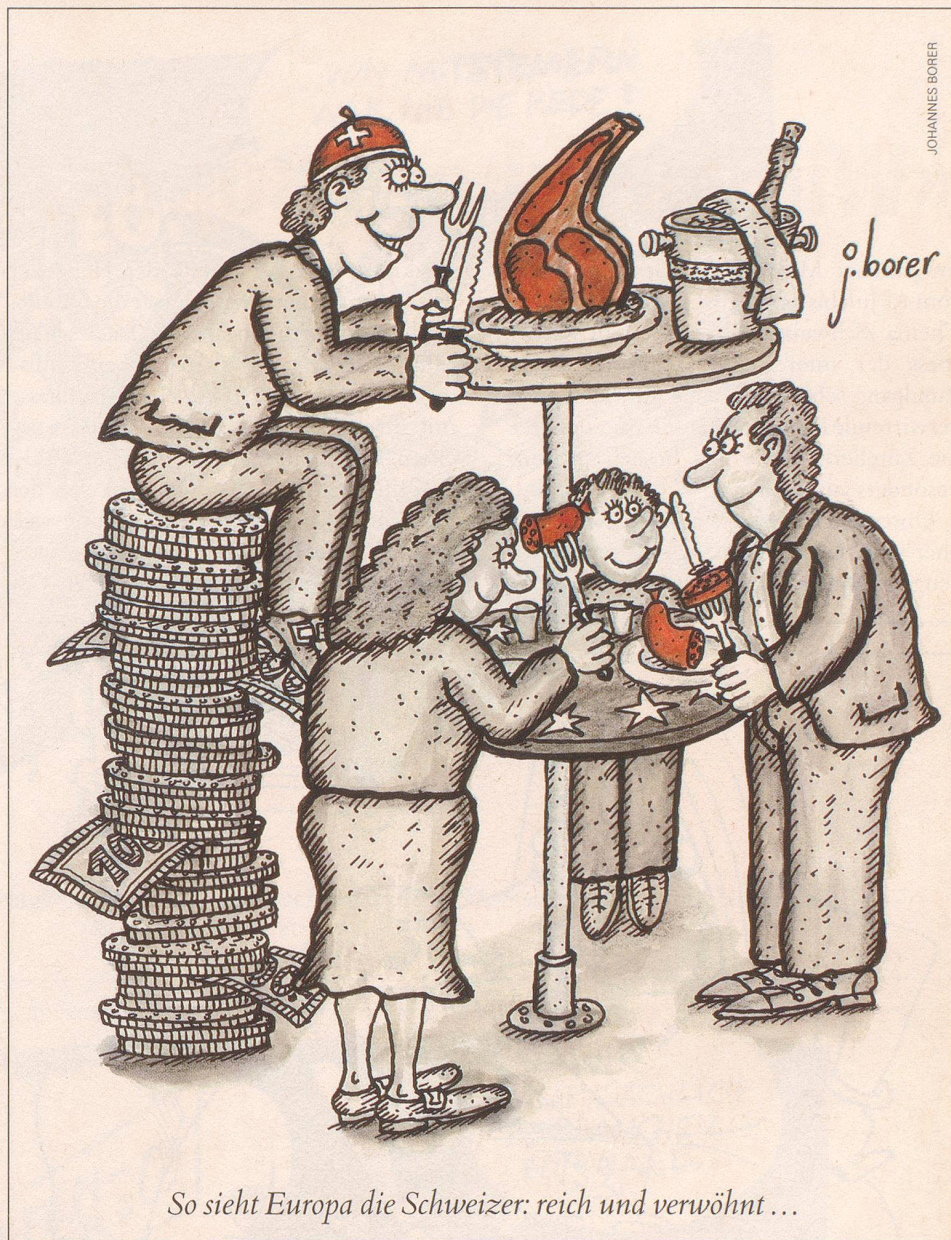
So sieht Europa die Schweizer: reich und verwöhnt ...

Herrn und Frau Schweizer bleibt nur die Hoffnung, dass sich die versammelte Prominenz in den kommenden vier Jahren vielleicht auch einmal daran erinnert, wozu und wofür sie eigentlich nach Bern gewählt worden ist.