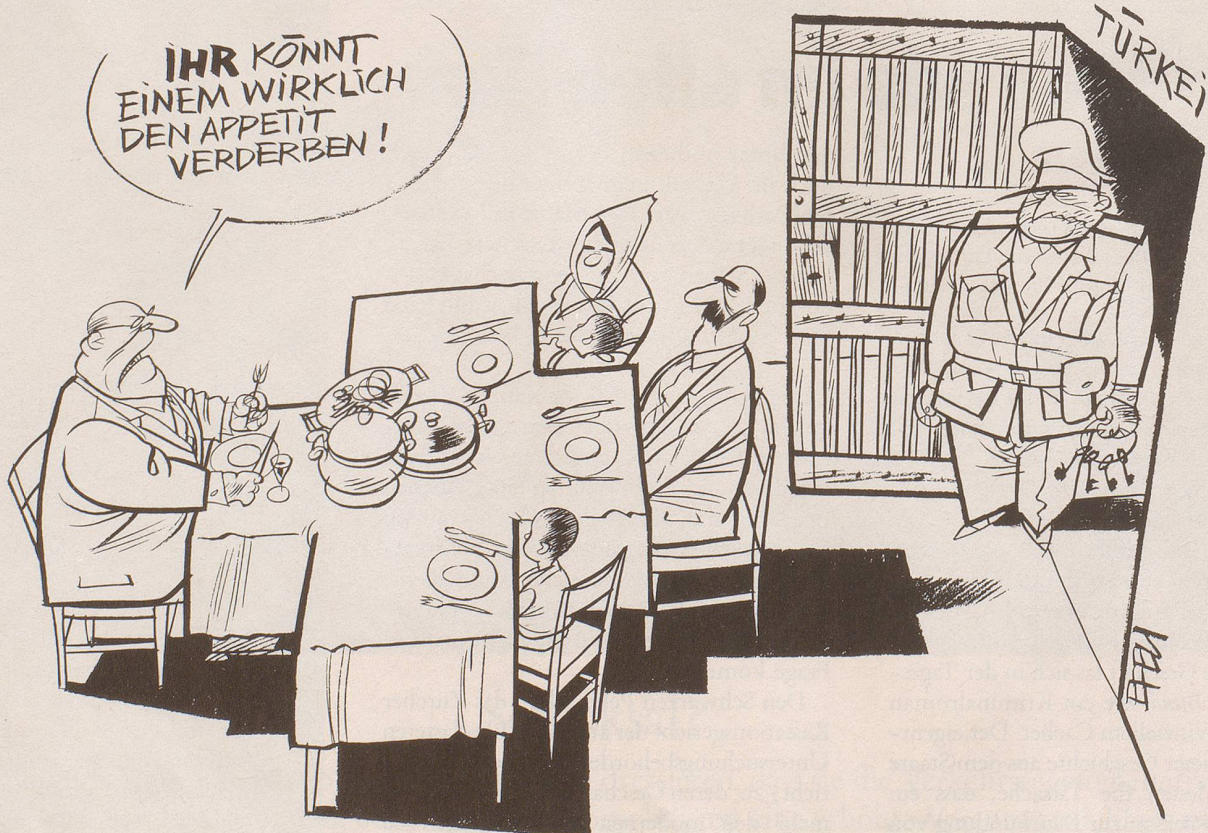
Recht vor Barmherzigkeit — oder umgekehrt? Die Kurden in Flüeli-Ranft sollen — wenn trotz Hungerstreik transportfähig — ausgewiesen werden ...