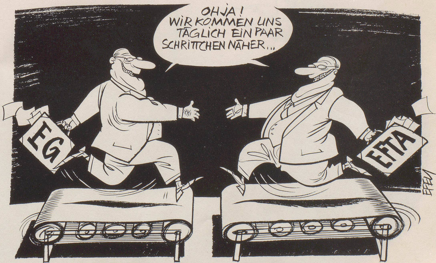
EG und EFTA kurz vor Vertragsabschluss ...