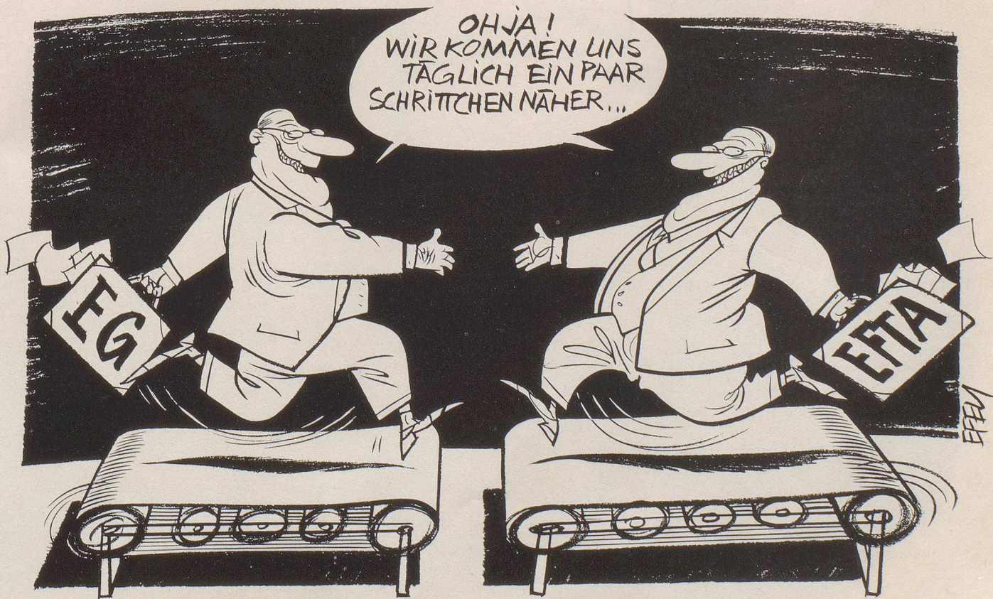
EG und EFTA kurz vor Vertragsabschluss ...