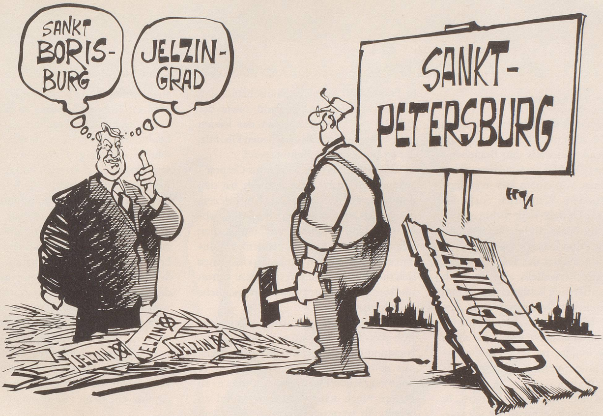
«Ich hätte da noch 'n paar Ideen gehabt!»