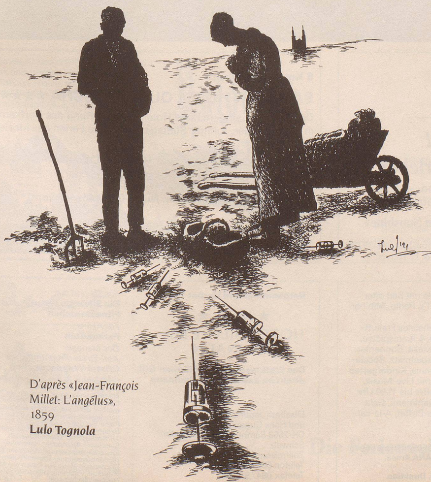
D'après «Jean-François Millet: L'angélus», 1859 Lulo Tognola

Ausstellung im Kornhaus Bern vom 5. Mai bis 4. August 1991