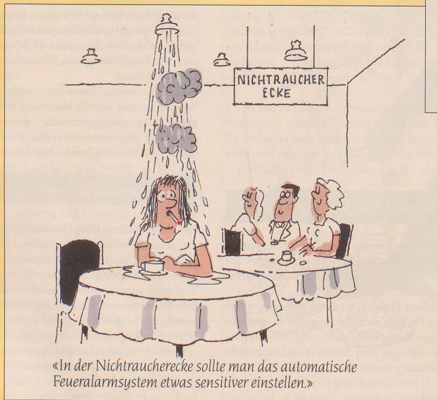
«In der Nichtraucherecke sollte man das automatische Feueralarmsystem etwas sensitiver einstellen.»