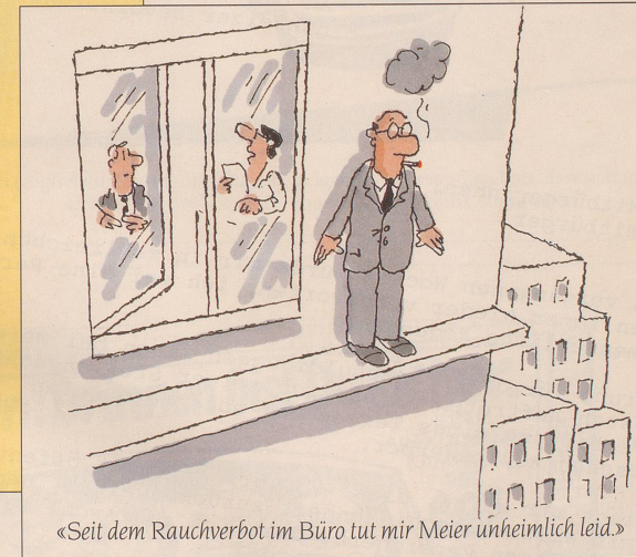
«Seit dem Rauchverbot im Büro tut mir Meier unheimlich leid.»