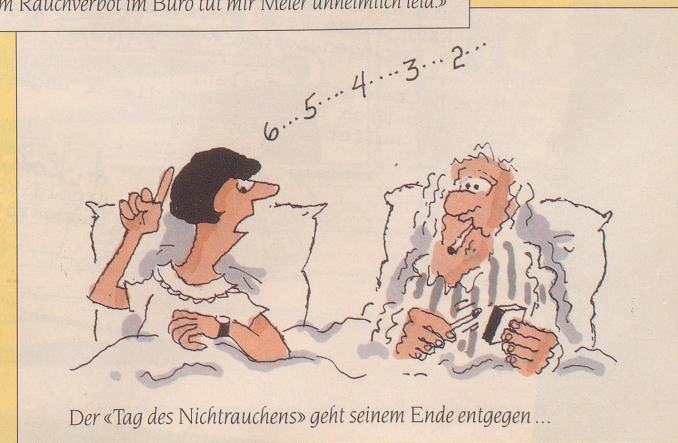
Der «Tag des Nichtrauchens» geht seinem Ende entgegen ...