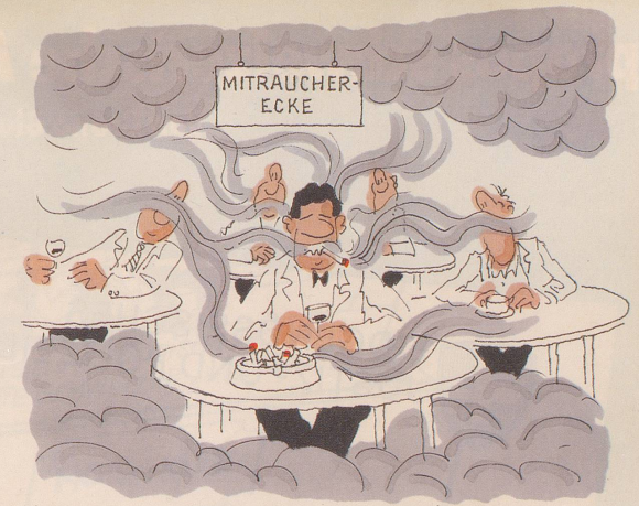
Die Gleichberechtigung darf nicht zu kurz kommen.