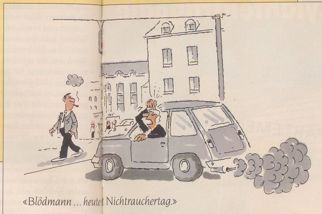
«Blödmann ... heute's Nichtrauchertag.»

Der «Tag des Nichtrauchens» fand in der Schweiz in diesem Jahr – statt wie gewöhnlich im Herbst – bereits am 31. Mai statt.