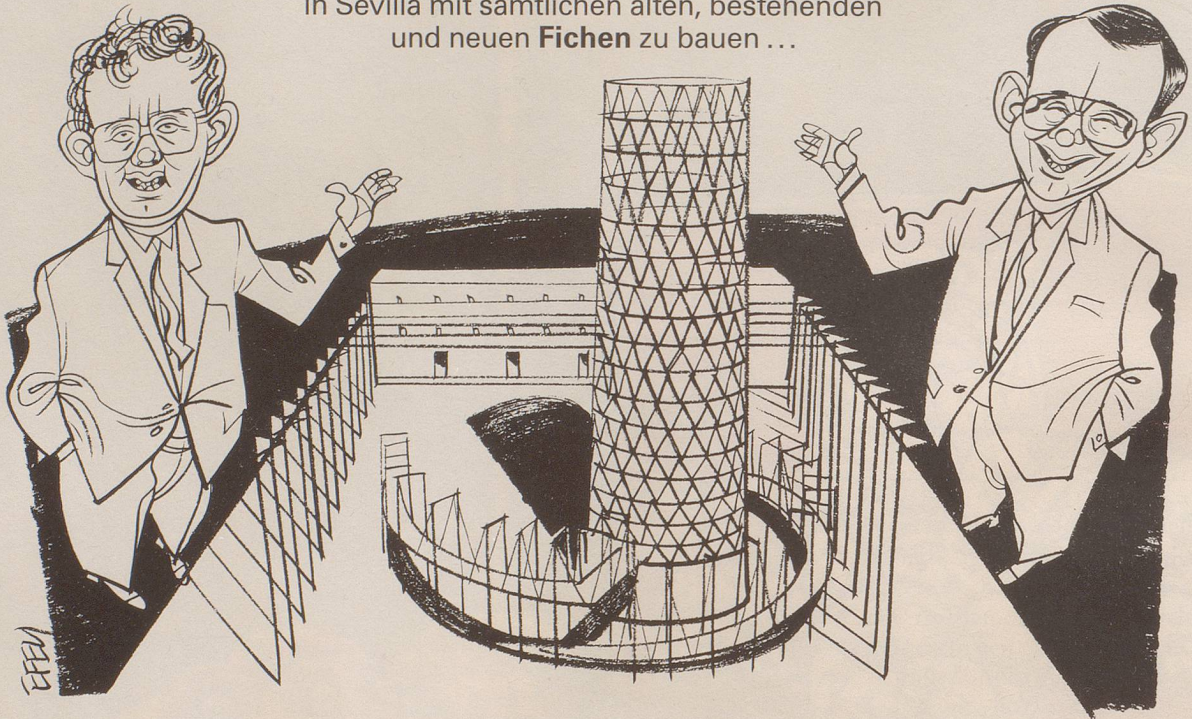
Zerwürfnisse um den Papierturm im Schweizer Pavillon an der Weltausstellung in Sevilla. Die Lösung wäre doch so naheliegend ...