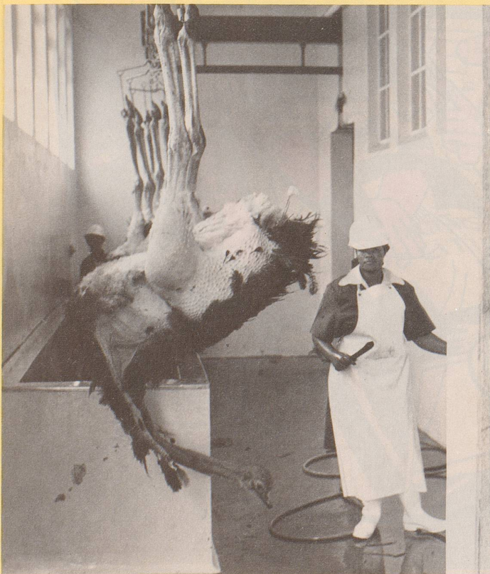
5) Heute gewinnt jedoch das leichte Geflügel an Terrain.