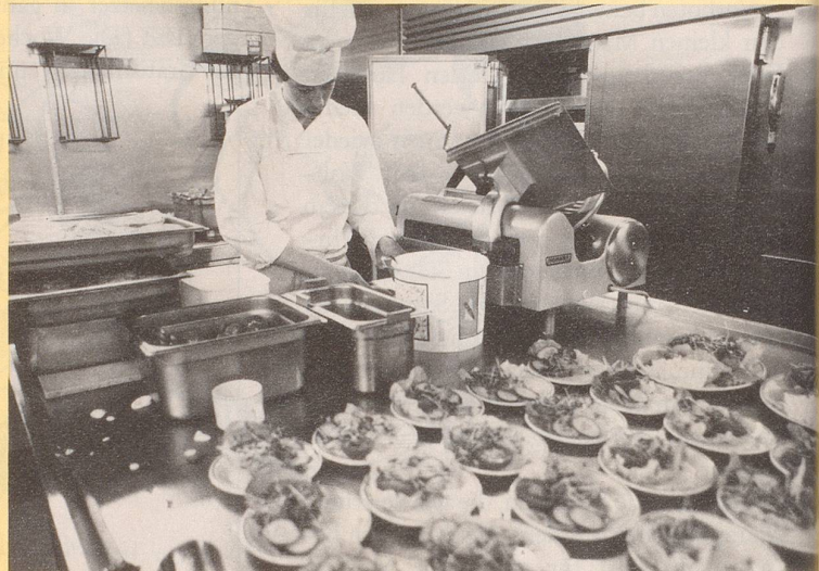
2) ... unsere Teller nicht mehr mit dem nötigen Fleisch zu füllen.