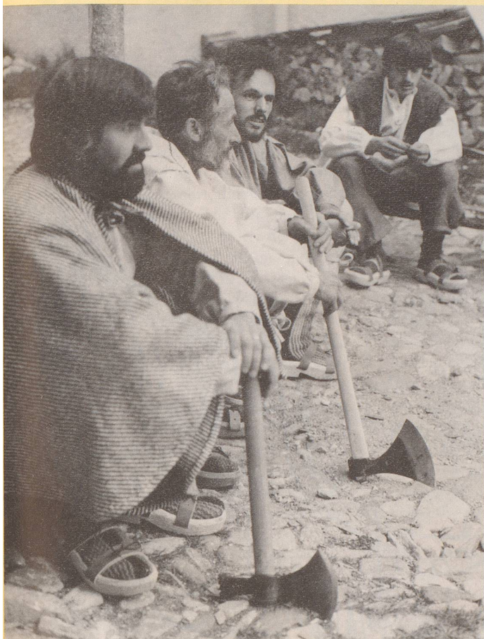
3) Schon unsere Ahnen begannen darum damit, ...

Der Fleischkonsum in der Schweiz steigt erfreulicherweise immer noch leicht an. Gegenwärtig isst jeder Eidgenosse (Säuglinge und Radio-Jubilare eingeschlossen), jährlich rund 90 Kilogramm Fleisch. Mit 76 Millionen Kilogramm vertilgten Geflügels brachen die Schweizer letztes Jahr zwar einen neuen Rekord im Pouletverzehr. Doch ist das, verglichen beispielsweise mit den USA, immer noch entschieden zuwenig.