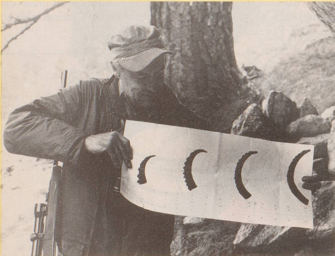
1) Längst vermag die freie Natur ...