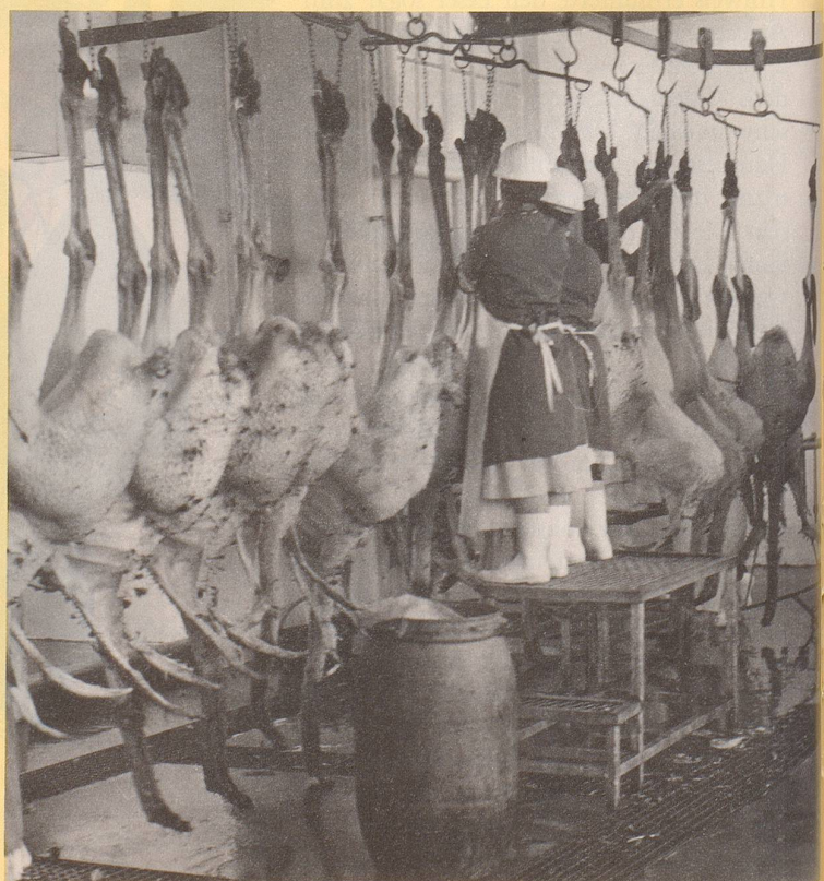
6) Gefragt sind junge, zarte «Mistkratzerli».