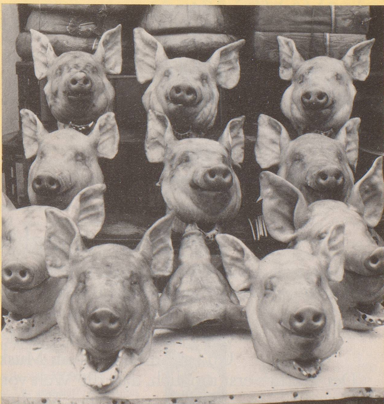
8) Und im Trend ist das glückliche Schwein.