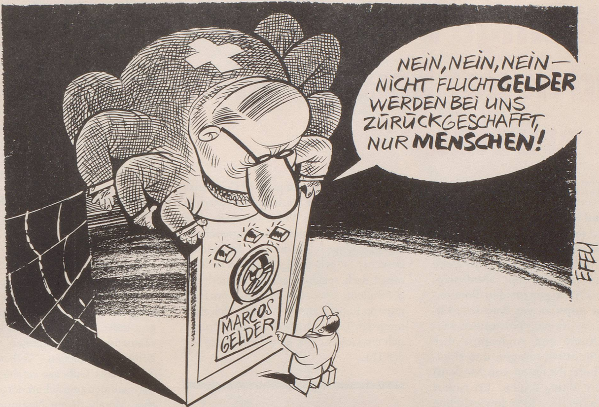
Während fast täglich Asylbewerber ausgeschafft werden, liegen Marcos-Fluchtgelder noch immer sicher in Schweizer Banktresoren ...

AUS DEM MACHEN WIR JETZT EINEN VOLKS-WAGEN MIT SOLAR-ANTRIEB !