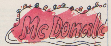
Quartier-Beizen sollten unbedingt etwas näher beim Zentrum liegen!

20 km in nördlicher Richtung, über den Chaschtenpass, links abbiegen und dann ist es das zweite Haus rechts.