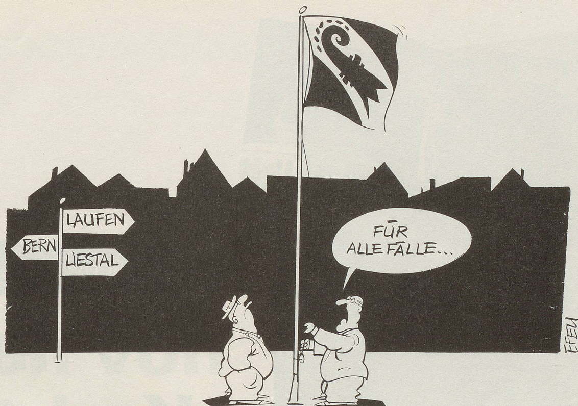
Konsequenzen des Berner Laufental-Entscheids!