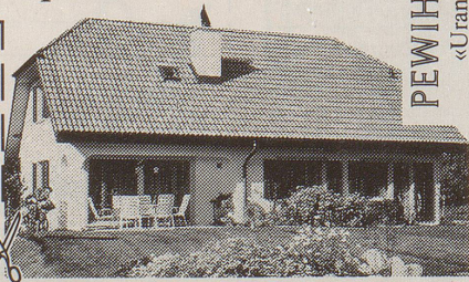
PEWIHAUS «Uranus» 505

Ich möchte das Pewihaus-Angebot kennenlernen und bestelle Ihren Katalog. Bitte senden Sie ihn mir an folgende Adresse: Name: _____ Strasse: _____ PLZ/Ort: _____