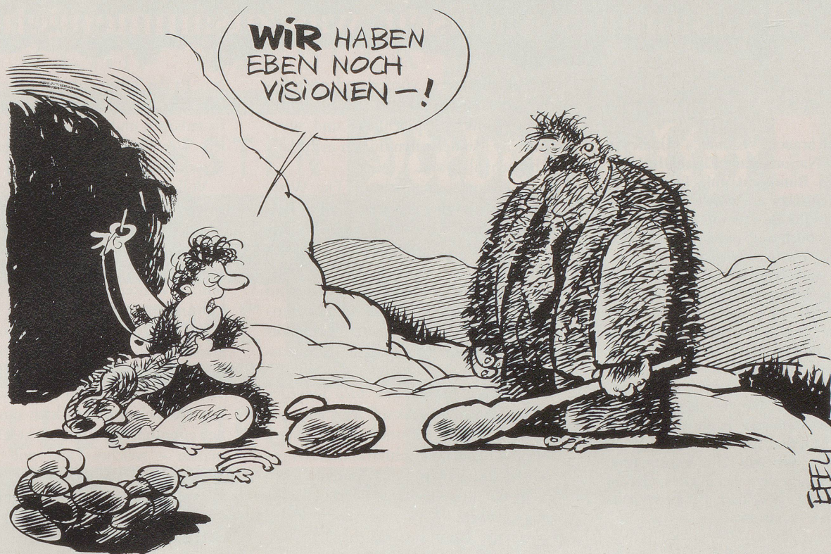
Eine von der Uni Genf durchgeführte Umfrage belegt die Fortschrittlichkeit der Frauen im Gegensatz zur eher konservativen Haltung der Männer, ...