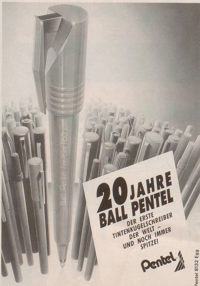
Pentel 8132 Egg