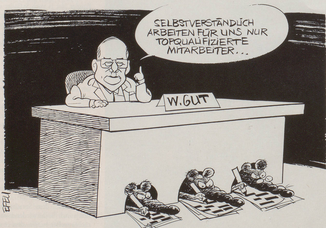
Die topqualifizierten Fichenabdecker sind natürlich altgediente Bupo-Leute ...