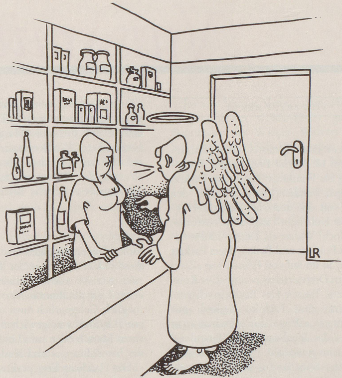
Ich hätte gern zwei Päckchen Vogelfutter

«Mein Mann trinkt nicht, raucht nicht, spielt nicht ...» «Was macht er denn in der Freizeit?» Er schimpft, weil die meisten anderen Männer das alles dürfen!»