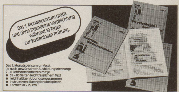
Das 1. Monatspensum umfasst (je nach gewünschter Ausbildungsrichtung) 2-6 Lehrstoffeinheiten mit je 35-80 Seiten leichtfasslichem Text, reichhaltigen Übungsprogrammen, instruktiven Illustrationsbeispielen. • Format 20 x 29 cm

Prüfen Sie, ob Sie Ihr Ziel erreichen können. Schicken Sie den Gutschein ein!