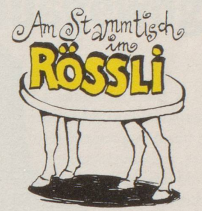
rg isch halt doch sicherer!»

«Irgendwie kann man sich gar nicht so richtig über das schöne Sommerwetter freuen. Kaum locken einen die ersten warmen Sonnenstrahlen nach draussen, wird uns das Vergnügen durch Hiobsbotschaften und eindringliche Warnungen auch schon wieder gründlich getrübt. Von zuviel Ozongehalt der Luft ist da die Rede und dass man sich hüten solle, am Abend noch joggen zu gehen, weil das mehr schade als nütze, und dass vor allem die Kinder nicht zuviel im Freien sein sollen, ganz zu schweigen von alten Menschen und Leuten mit Asthmabeschwerden. Ja aber, verdammt noch mal, was wird denn eigentlich von den Behörden getan in dieser Beziehung?»