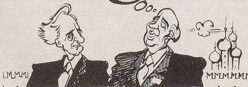
«Ich glaube, vorerst geht von einem vereinigten Deutschland keine Gefahr aus.»