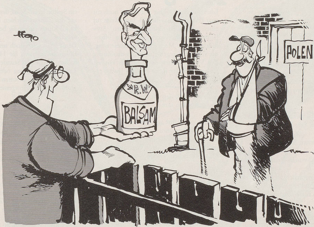
«Da, Herr Nachbar, etwas zum Einreiben!»