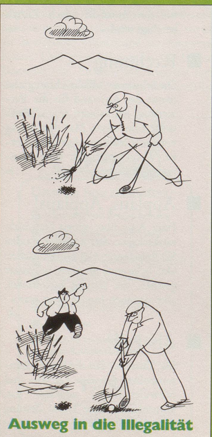
Ausweg in die Illegalität