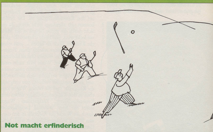
Not macht erfinderisch