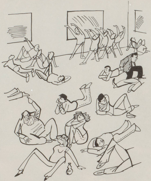
Der neue Beruf: Kunstanimator