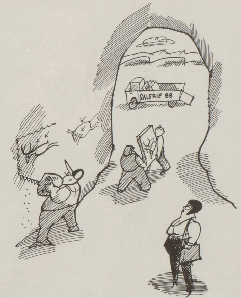
Späte Anerkennung eines unbekanntem Künstlers.