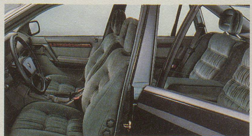
Stilvolle Eleganz: das neue Interieur.

3-fach abklappbare hintere Rückenlehne gedacht wurde. Und Sie werden sich lange darüber freuen können, für Fr. 51'000.- (Senator CD, Abb.) ungewöhnlich viel Gegenwert erhalten zu haben (weiteres Modell: Senator 3.0i mit elektron. 4-Stufen-Automatik und ABS Fr. 38'500.-).