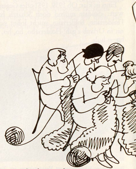
Die erstarkende Frauenbewegung während des Krieges