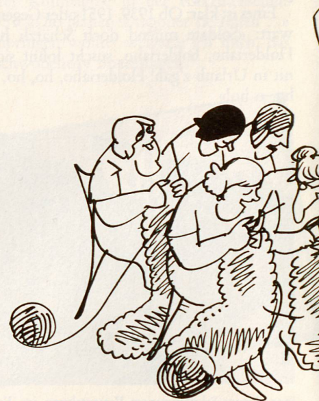
Die erstarkende Frauenbewegung während des Krieges