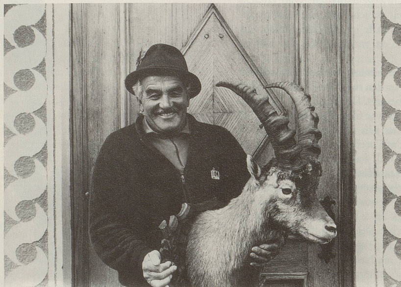
1 Das männliche Selbstwertgefühl ...