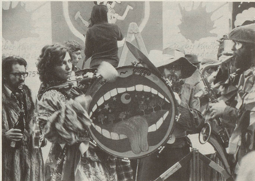
4 Längst ist nicht mehr klar, wer in unserer Gesellschaft den Marsch bläst und wer auf die Pauke haut.