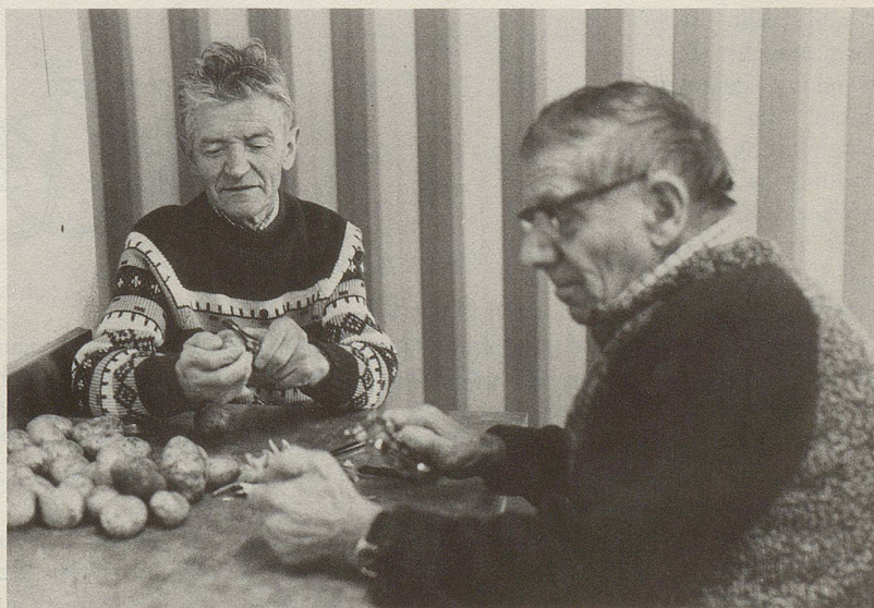
8 ... durch bedingungslose Solidarität.