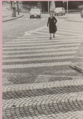
6 ... die gemeinsame Richtung.