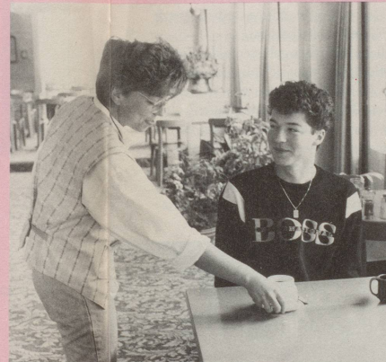
3 Du sorgtest täglich dafür, dass es Dein Junge besser hatte als Du.