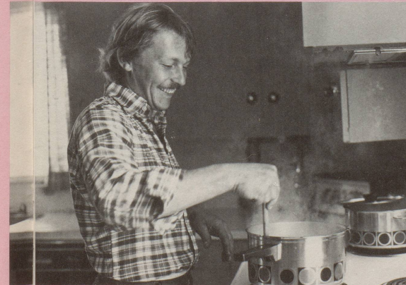
7 ... Und einmal im Jahr – am Muttertag – beweisen Dir Deine Männer, ...