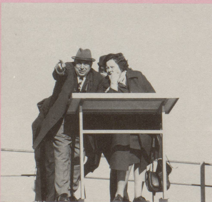
5 Mit starker Hand weist er ...