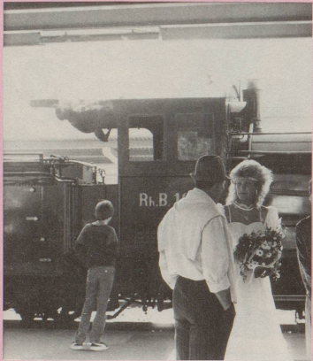
1 An jenem «schönsten Tag Deines Lebens» hast Du den Mann geheiratet, ...