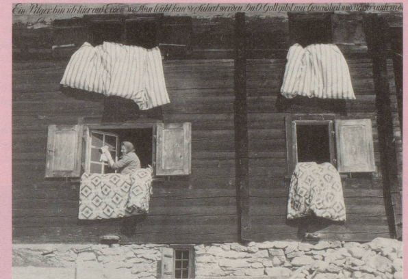
4 Dein Mann unterstützt Dich tatkräftig in Deiner fraulichen Selbstverwirklichung.