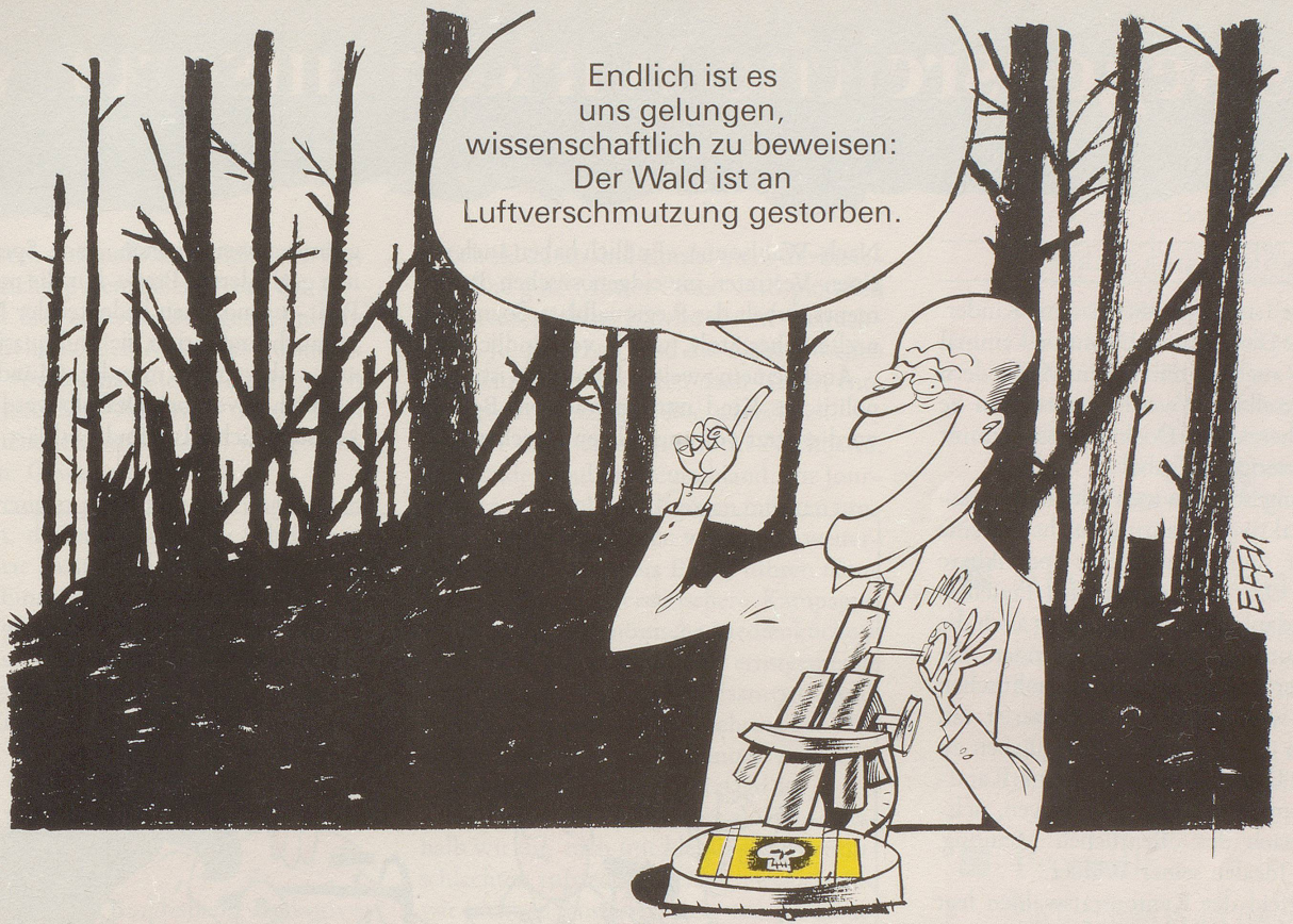
Ein jahrelanges Forschungsprogramm erhärtet die Vermutung, die Luftverschmutzung mache den Wald krank. Aber bewiesen ist damit natürlich noch nichts!