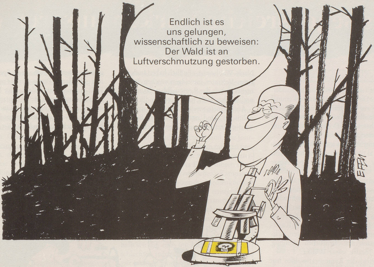
Ein jahrelanges Forschungsprogramm erhärtet die Vermutung, die Luftverschmutzung mache den Wald krank. Aber bewiesen ist damit natürlich noch nichts!