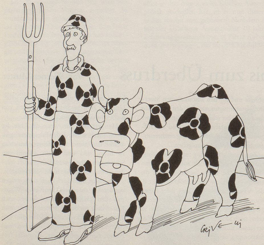
«Die wegen der nuklearen Katastrophe von Tschernobyl am stärksten radioaktiven Leute der Schweiz sind Bauern im Tessin ...» (Zitiert aus «Quotidiano» vom 2. März 1988.)

Zu den ersten messbaren Auswirkungen des neuen Eherechts teilt der inexistente Verband der Schweizerischen Zivilstandsbeamten mit: Die meisten verheirateten Damen, welche früher ein «von» vor dem Namen trugen, haben sich entschlossen, wieder ihren Jungmädchennamen zu tragen und sich erneut «von» zu schreiben. Dagegen sei aber bisher noch kein Fall bekannt geworden, wo eine angeheiratete «Frau von» wiederum Liseli Müller, Schneider, Gerber, Schmid oder Fischer heissen wollte. Werner Muster