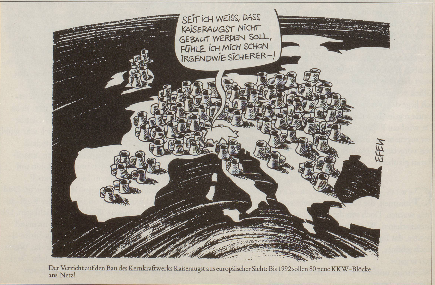
Der Verzicht auf den Bau des Kernkraftwerks Kaiseraugst aus europäischer Sicht: Bis 1992 sollen 80 neue KKW-Blöcke ans Netz!