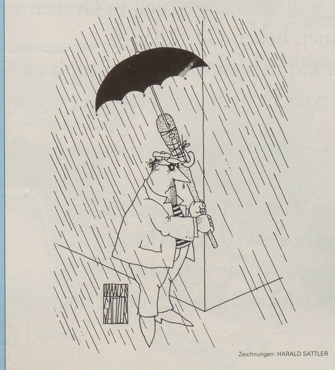
Zeichnungen: HARALD SATTLER

«Chef, wenn ich kündige, verlieren Sie einen Ihrer besten Mitarbeiter!» «Wer geht denn noch mit Ihnen?»