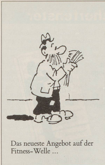
Das neueste Angebot auf der Fitness-Welle ...