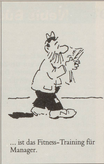
... ist das Fitness-Training für Manager.