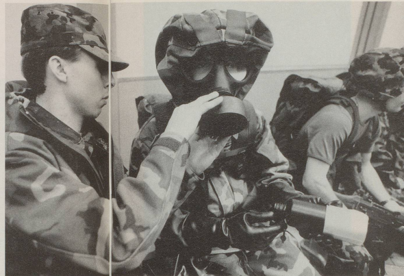
... dass optische Abschreckung und ...