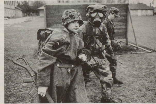
Oberstes Gebot bleibt allerdings einheitliche, korrekte Kleidung.