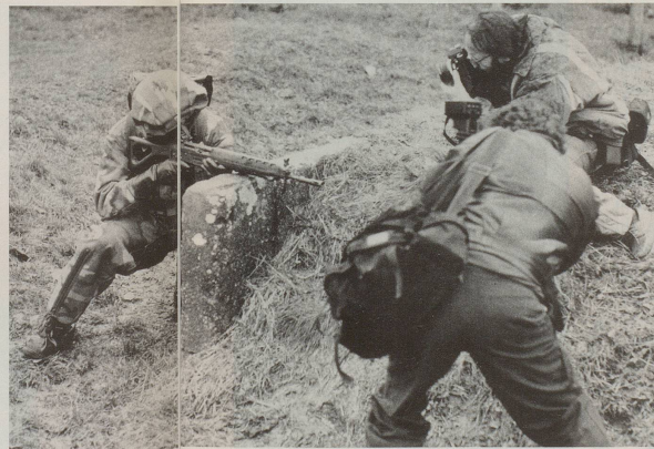
... während die Neuerungen im Inland vor allem im Nahkampf beeindrucken.