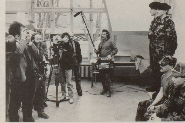
Übrigens: Diese Angaben sind streng vertraulich. Der Gegner darf nichts erfahren.