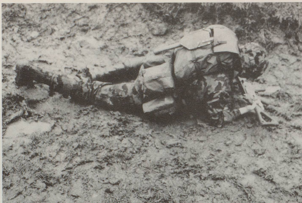
... durch den Dreck ziehen. Im Gegenteil: Wir sind überzeugt davon, ...