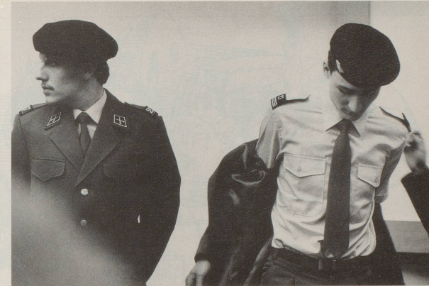
... das Verkleiden als Pösterler jeden Gegner vollständig verwirren wird.