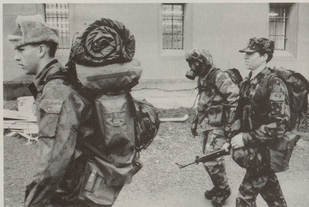
Der neue Trampfer-Rucksack ermöglicht zudem endlich auch Einsätze im Ausland, ...