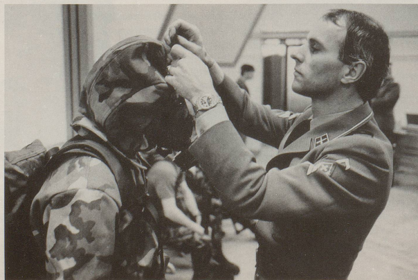
Alles in allem: ein Segen.