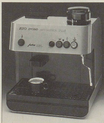
Rio d'Oro Automatica Plus

Die Espressomaschine die vollautomatisch arbeitet. Sie mahlt den Kaffee, füllt das Sieb, brüht den Kaffee, wirft den Satz weg und ist wieder bereit für den nächsten Knopfdruck, alles auto- matisch. Für köstlichen Espresso oder herrlichen Kaffee. Mit separater Düse für Heisswasser und Schnelldampf. 2 Jahre Garantie. Einfach sauber, kinderleicht.