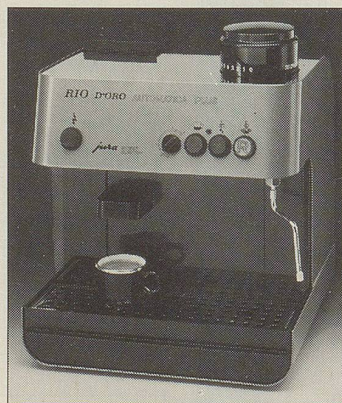
Rio d'Oro Automatica Plus

Die Espressomaschine die vollautomatisch arbeitet. Sie mahlt den Kaffee, füllt das Sieb, brüht den Kaffee, wirft den Satz weg und ist wieder bereit für den nächsten Knopfdruck, alles auto- matisch. Für köstlichen Espresso oder herrlichen Kaffee. Mit separater Düse für Heisswasser und Schnelldampf. 2 Jahre Garantie. Einfach sauber, kinderleicht.