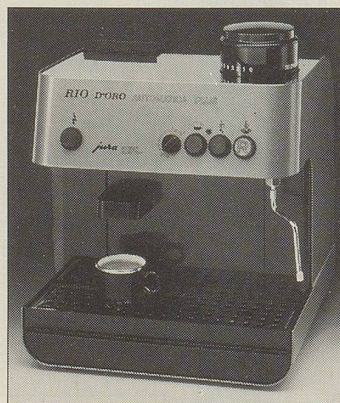
Rio d'Oro Automatica Plus

Die Espressomaschine die vollautomatisch arbeitet. Sie mahlt den Kaffee, füllt das Sieb, brüht den Kaffee, wirft den Satz weg und ist wieder bereit für den nächsten Knopfdruck, alles auto- matisch. Für köstlichen Espresso oder herrlichen Kaffee. Mit separater Düse für Heisswasser und Schnelldampf. 2 Jahre Garantie. Einfach sauber, kinderleicht.