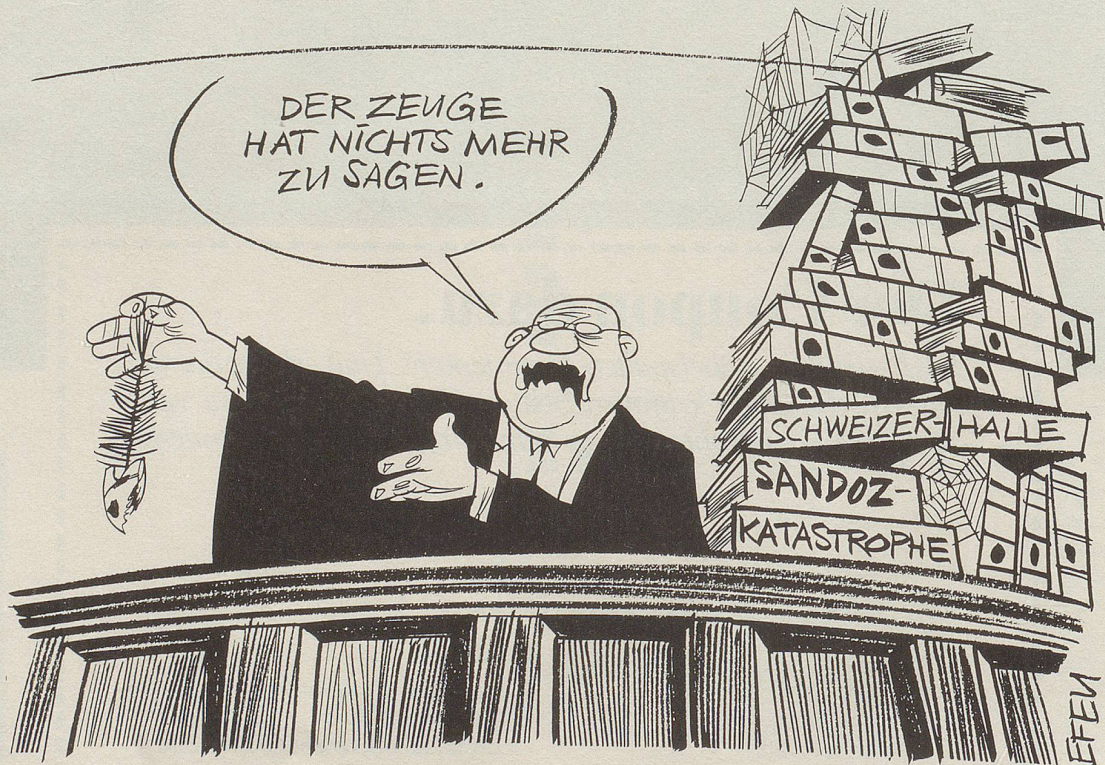
Die rechtliche Bewältigung der Katastrophe von Schweizerhalle macht enorme Fortschritte: Zwei Fernsehjournalisten, die im Bild zeigen wollten, wie qualvoll Lebewesen im Rhein nach der Vergiftung durch Chemikalien verenden mussten und dafür einen Fisch opferten, wurden zu je Fr. 100.- Busse und Übernahme der Verfahrenskosten verurteilt. Der Prozess gegen die Verantwortlichen des Brandes von Schweizerhalle liegt dagegen noch in weiter Ferne. Für die damals angerichteten Tierquälereien können sie jedenfalls nicht mehr zur Rechenschaft gezogen werden: Dieser Straftatbestand ist – zwei Jahre nach der Katastrophe – verjährt ...