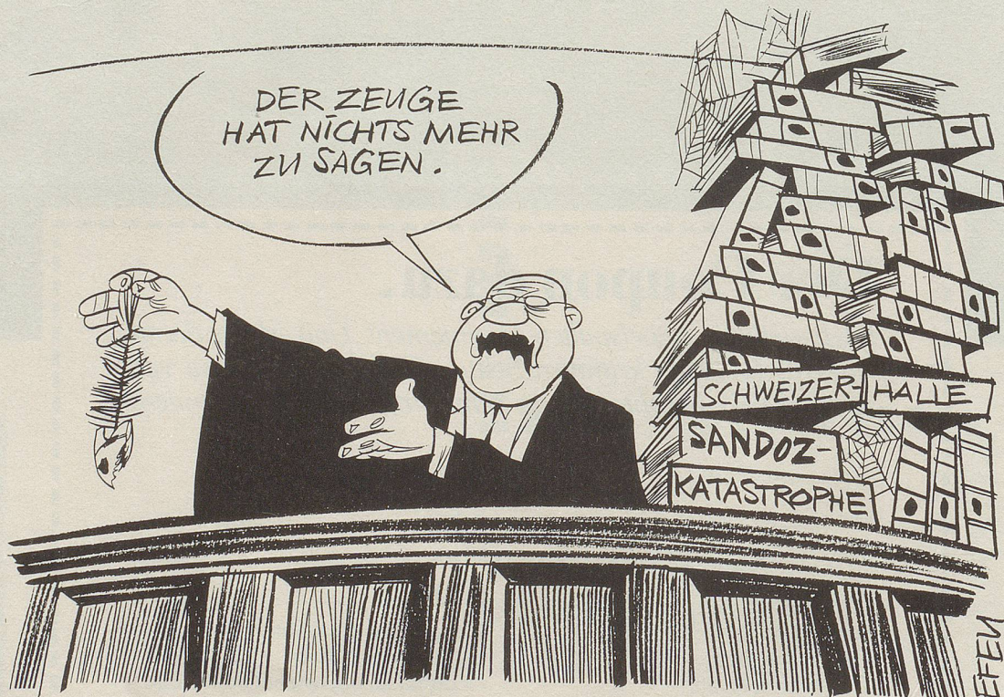
Die rechtliche Bewältigung der Katastrophe von Schweizerhalle macht enorme Fortschritte: Zwei Fernsehjournalisten, die im Bild zeigen wollten, wie qualvoll Lebewesen im Rhein nach der Vergiftung durch Chemikalien verenden mussten und dafür einen Fisch opferten, wurden zu je Fr. 100.- Busse und Übernahme der Verfahrenskosten verurteilt. Der Prozess gegen die Verantwortlichen des Brandes von Schweizerhalle liegt dagegen noch in weiter Ferne. Für die damals angerichteten Tierquälereien können sie jedenfalls nicht mehr zur Rechenschaft gezogen werden: Dieser Straftatbestand ist – zwei Jahre nach der Katastrophe – verjährt ...