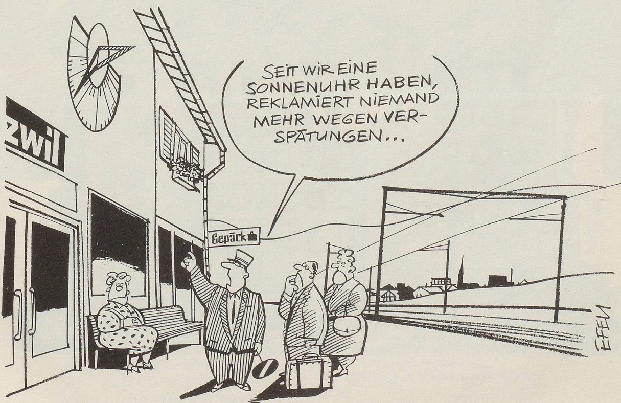
Aus verschiedenen Gründen, die zusammenwirken, sind die SBB aus dem Takt geraten. Täglich häufige Verspätungen sind nicht mehr die Ausnahme, sondern die Regel.