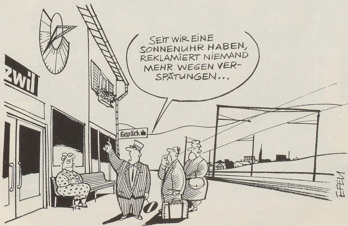
Aus verschiedenen Gründen, die zusammenwirken, sind die SBB aus dem Takt geraten. Täglich häufige Verspätungen sind nicht mehr die Ausnahme, sondern die Regel.