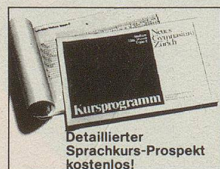
Detaillierter Sprachkurs-Prospekt kostenlos!

Fast nebenbei eignet man sich dabei auch den wichtigsten Wortschatz und die unumgängliche Grammatik an. Oft werden Sie sich bei diesem faszinierenden Sprachstudium ins Ausland versetzt fühlen und glauben, selber an interessanten Gesprächen in Cafés, Familien oder Geschäften persönlich teilzunehmen. Das abwechslungsreiche Studium ist derart spannend aufgebaut und vergibt fast wie im Fluge, so dass gegen Lehrgangende die sorgfältige Einführung in die leichtere fremdsprachliche Literatur und in die private und geschäftliche Fremdsprachenkorrespondenz für Sie nicht mehr schwierig sein wird. Sie geniessen also eine umfassende Ausbildung, die einem längeren Auslandsprachenaufenthalt absolut gleich kommt. Am Schluss des lehrreichen Kurses wird es Ihnen möglich sein, sich in der Fremdsprache Ihrer Wahl flüssend und ungezwungen zu unterhalten, Bücher zu lesen, aber auch Briefe in einem vorbildlichen Stil zu verfassen.