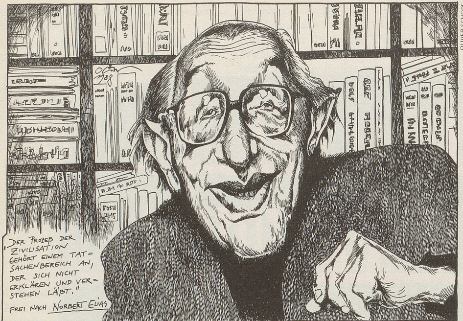
Sokratisches Resümee nach 91 Jahren