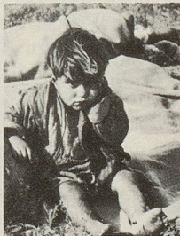
Einziger Überlebender einer ganzen Familie