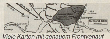
Viele Karten mit genauem Frontverlauf