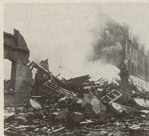
1.400 Tonnen Bomben zerstören Essen in einer Nacht

Fordern Sie diese 3 Bände unverbindlich zur Ansicht an.