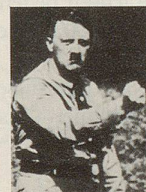
Adolf Hitler läßt riesige Konzentrationslager errichten