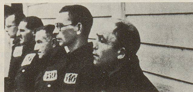
Nach der Machtergreifung 1933: Politische Häftlinge