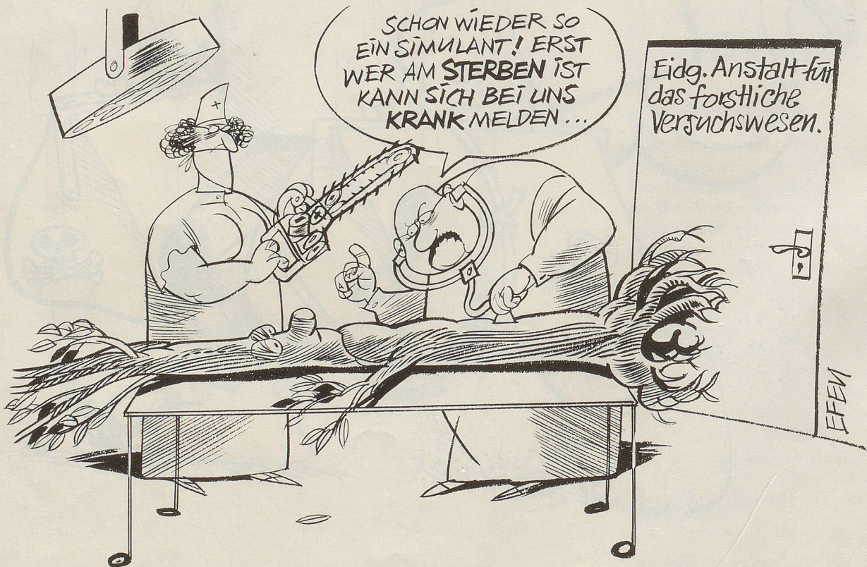
Rodolphe Schläpfer (Direktor der Eidg. Anstalt für das forstliche Versuchswesen) hat sich mit seinem Vorschlag, den Begriff «Waldsterben» durch den scheinbar weniger gravierenden Ausdruck «Vitalitätsverlust» zu ersetzen, dem Vorwurf der Verharmlosung ausgesetzt.