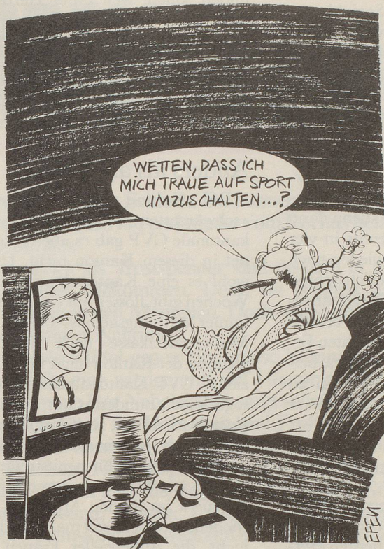
Publikums-Liebling Thomas Gottschalk gastiert mit seiner «Wetten, dass ...»-Sendung in Basel.