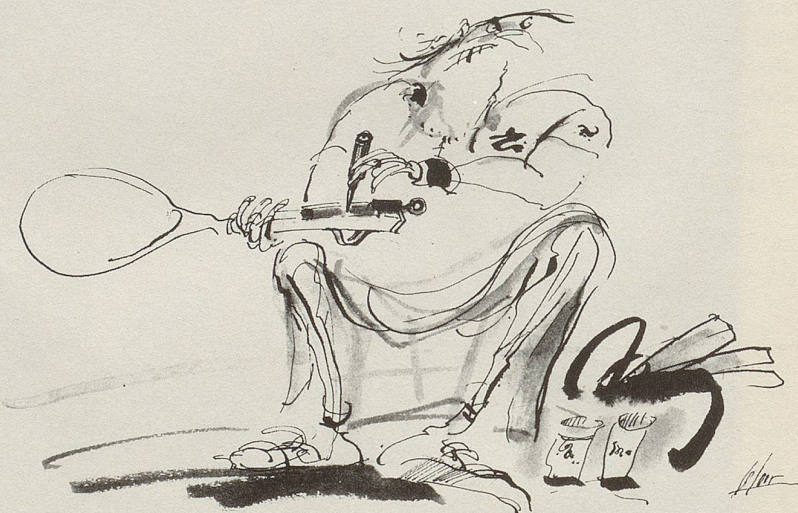
Vor dem tie-break