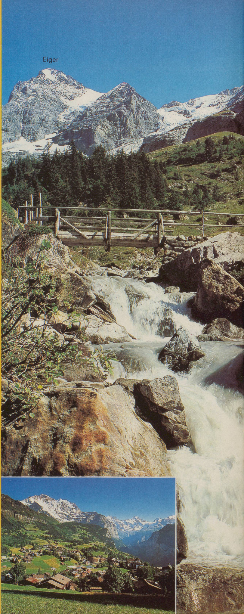
Wengen mit Jungfrau