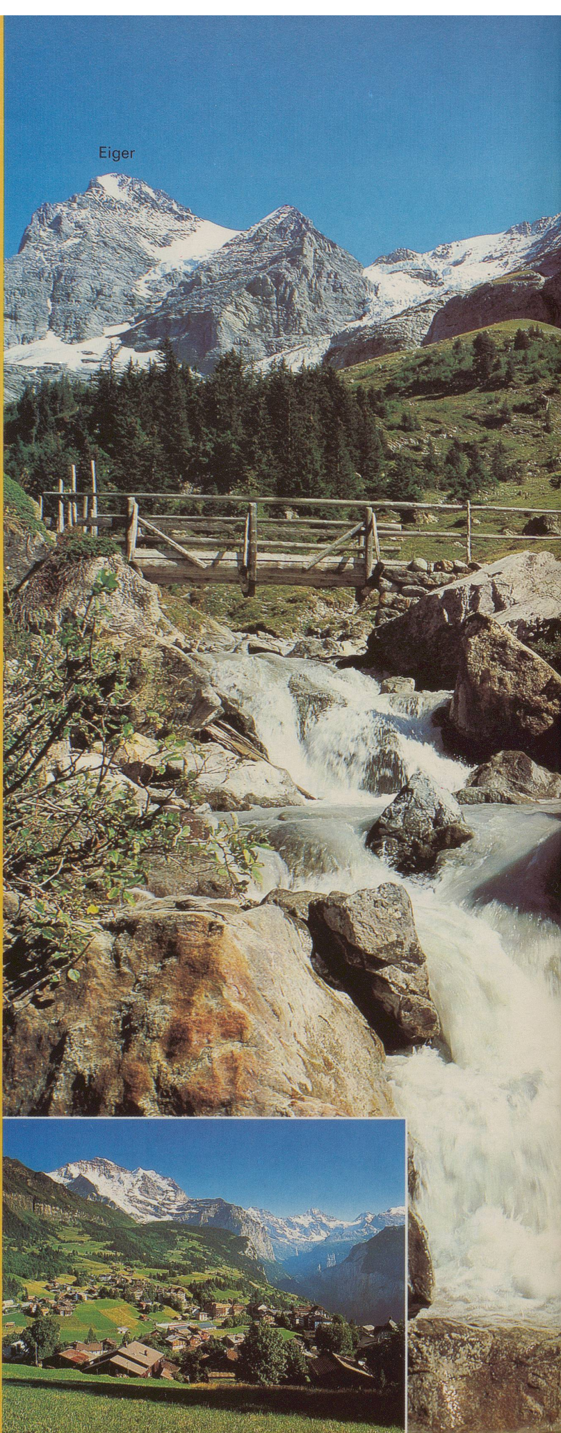
Wengen mit Jungfrau