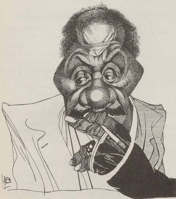
Jamelão, ein Musiker (Illustration für die Zeitschrift Pasquim )