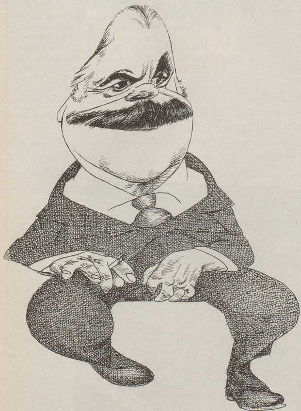
Der brasilianische Staatspräsident, José Sarney, (erschieden in O Espírito da Coisa )