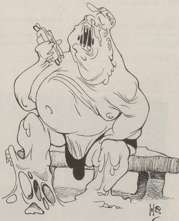
Illustration für die Studentenzeitschrift Vestibulando