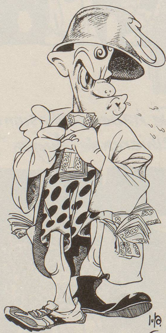
Illustration für Jornal de Miracema

1985 nahm er an den Cartoon-Festivals von Piauí und Niterói teil, wo er jeweils unter den zwölf besten Karikaturisten rangierte.